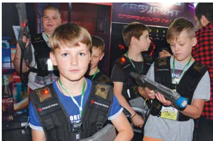
В лазертаге все было классно!

Убедительная победа со счетом 5:2 обеспечила ногинчанам выход в 1/4 Кубка.