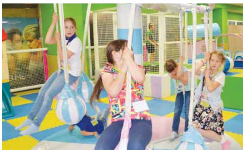
В детской игровой зоне.