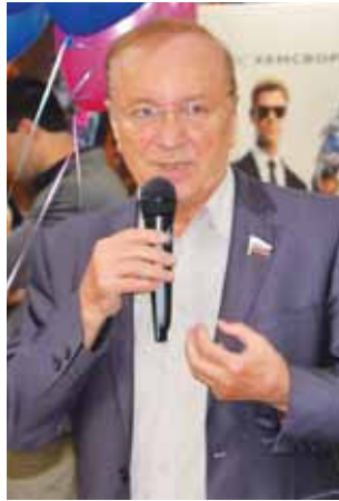
Детей в Ногинске поздравил сенатор Игорь Чернышенко...

На третьем этаже, где проходил праздник, разукрашенном разноцветными воздушными шарами, детей в праздничный оборот сходу брали аниматоры и веселые клоуны, вовлекая их участвовать в различных конкурсах, му-