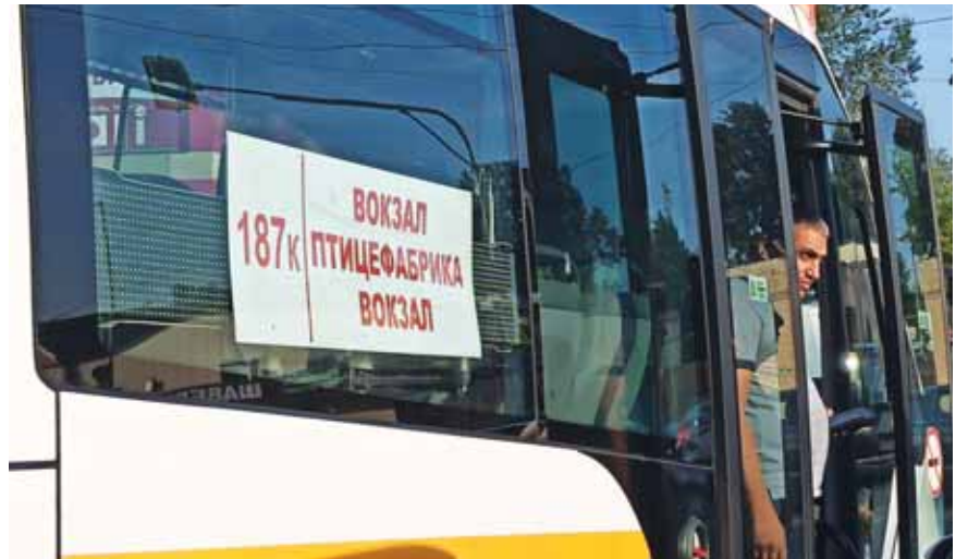
Номера маршрутов хоть и указаны, как межмуниципальные, но маршрут остался внутригородским.

ООО «БСК-5» уже более 20 лет перевозит жителей и гостей Ногинска, автобусный парк постоянно обновляется, предоставляются льготы при