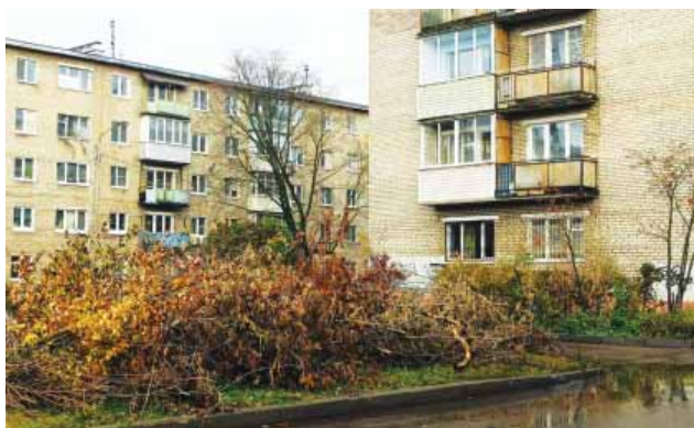
Больше двух недель после завершения «благоустройства» гора из спиленных веток и деревьев возвышалась рядом с домом.

А часть срезанного асфальта свалили в огромную кучу у западного торца здания. А потом, чтобы не вывезти, взяли и разровняли его. Хотя там была газонная часть, росла трава, деревья. Теперь все это уничтожено, и мы вынуждены ходить по этой асфальтовой щебенке, вместо уничтоженного ими тротуара. Плюс ко всему, здесь же выросла целая